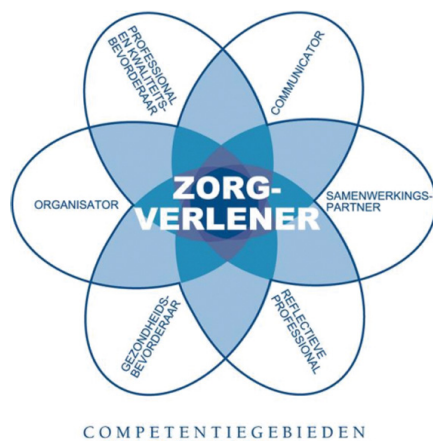
Figuur 1. CanMEDS-systematiek

Binnen de opleiding tot dialyse-assistent wordt gebruik gemaakt van de CanMeds- rollen. Om de verbinding tussen de opleiding en het Expertisegebied duidelijk te maken komen de kennis en vaardigheden uit de opleiding terug in het expertisegebied. Vervolgens worden vanuit deze basis de aanvullende kennis en vaardigheden van de dialyse-assistent beschreven. Dit alles wordt uitgewerkt aan de hand van de CanMEDS-systematiek (Canadian Medical Education Directives for Specialists). Deze systematiek bestaat uit zeven verschillende rollen. De kern van de beroepsuitoefening is de dialyse-assistent als zorgverlener. Alle andere rollen zijn ondersteunend voor de rol van zorgverlener. Deze centrale rol geeft richting aan de andere CanMEDS-rollen.